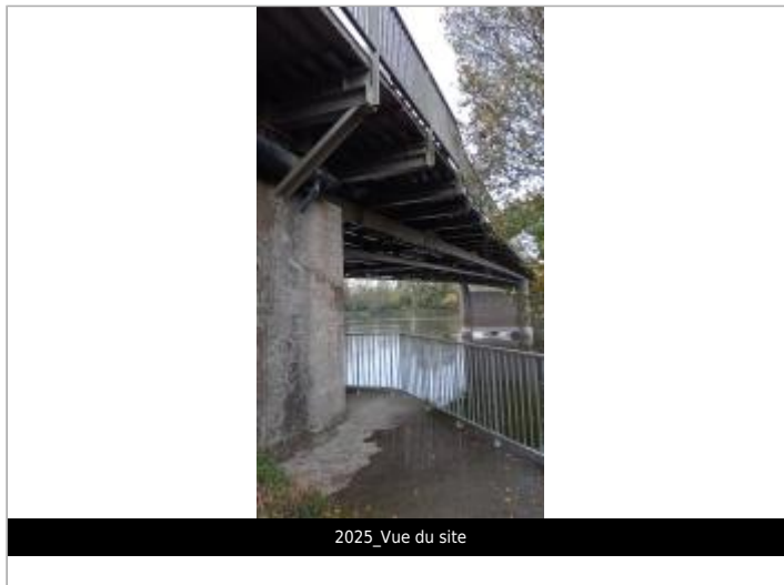
2025_Vue du site