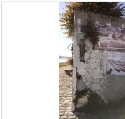
2025_Vue du repère 1856 (disparu)