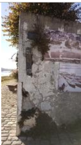
2025_Vue du repère 1856 (disparu)

Système altimétrique : NGF IGN 1969 (système normal)