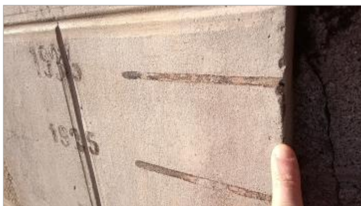
2025_Vue du repère 1923 (disparu)