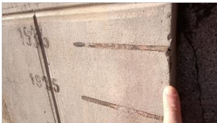
2025_Vue du repère 1923 (disparu)