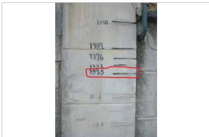
Vue du repère 1995_Années 2010