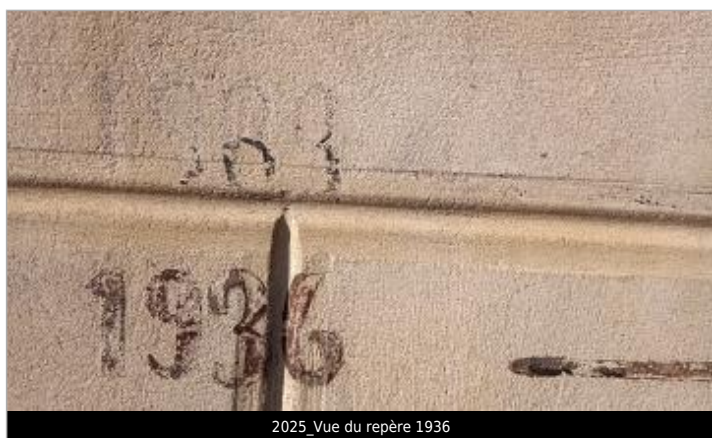
2025_Vue du repère 1936