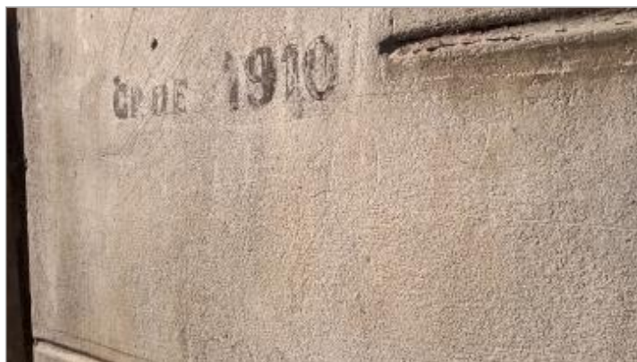
2025_Vue du repère Noël 1982

Type de repérage : Source bibliographique