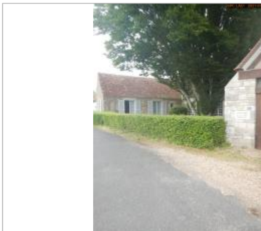
Vue du site en 2021