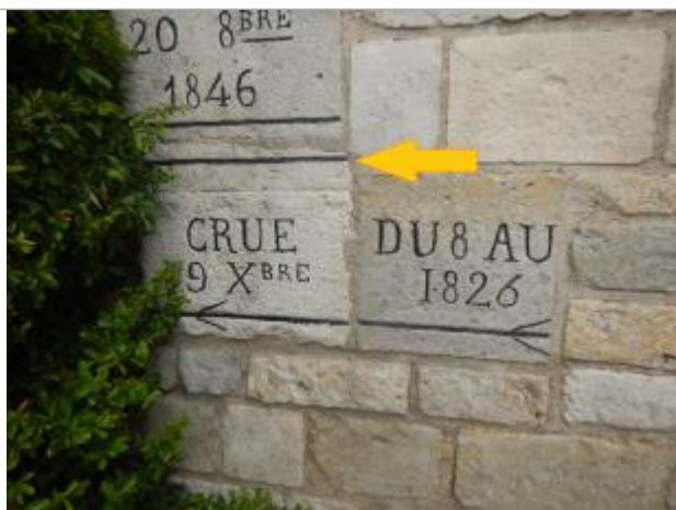
Vue du repère rapprochée en 2021

Altitude calculée de l'eau (en m) : 112.498 m