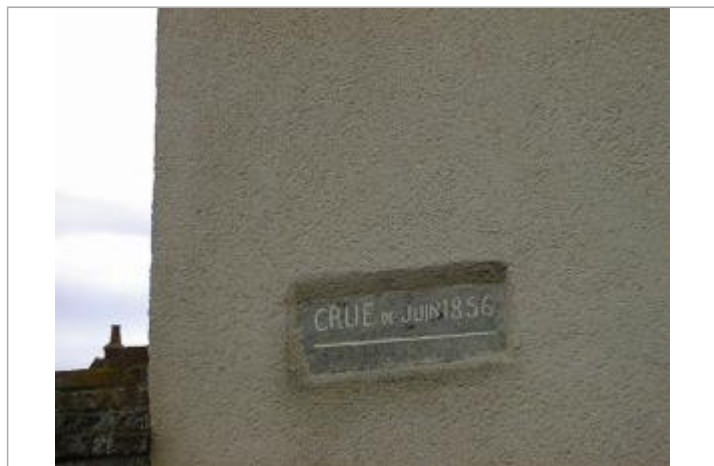
Vue de détail du repère