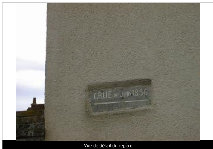
Vue de détail du repère

Altitude calculée de l'eau (en m) : 100.38 m