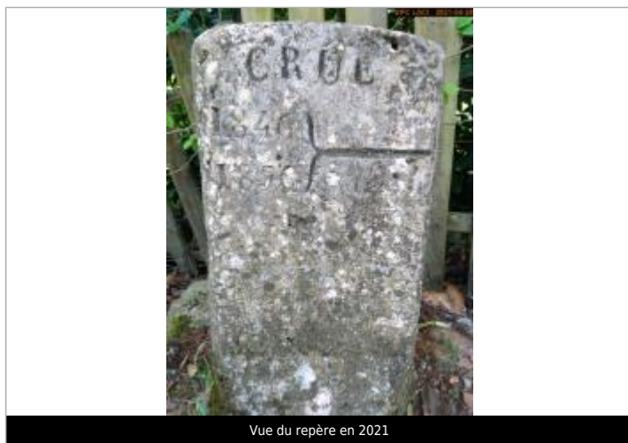
Vue du repère en 2021