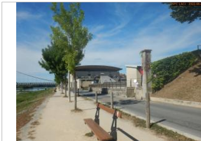
Vue du repère éloignée