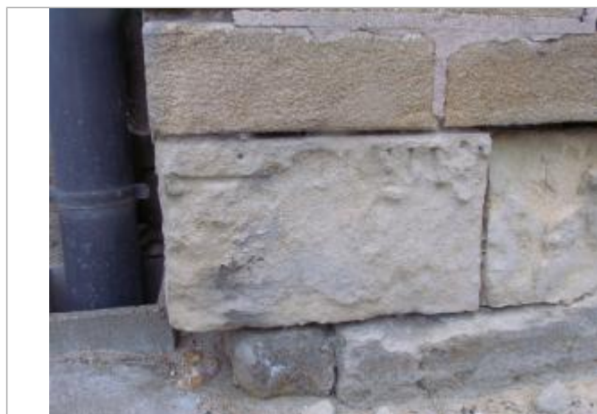
Vue du repère rapprochée en 2003