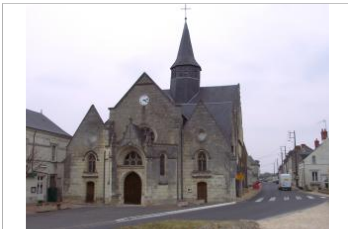
Photo du recensement d'origine en 2003