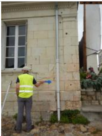
Vue du repère en 2021

Altitude calculée de l'eau (en m) : 34.44 m