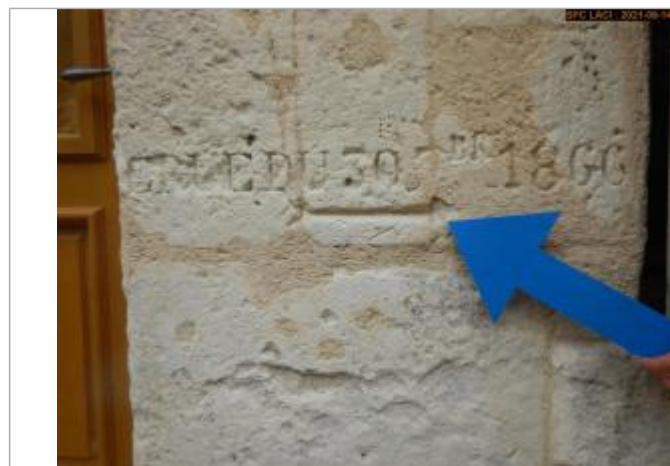
Vue du repère rapprochée en 2021