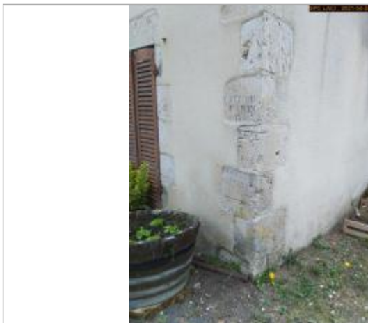
Vue du repère en 2021