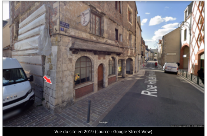
Vue du site en 2019