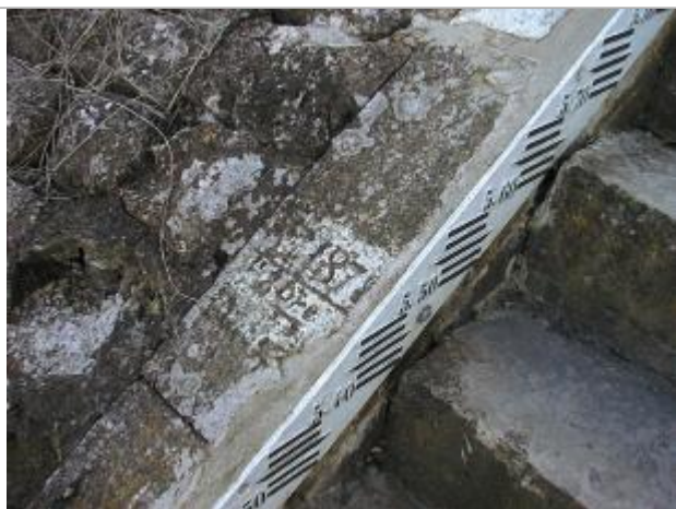
Vue du repère initiale

Altitude calculée de l'eau (en m) : 32.34 m