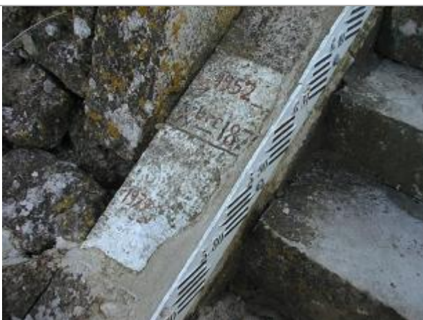
Années 2010_Photo du repère 1952

Altitude calculée de l'eau (en m) : 32.7 m