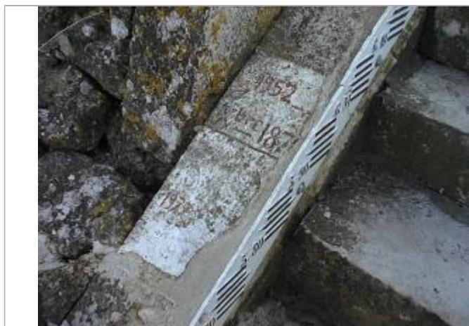
Années 2010_Photo du repère 1952

Altitude calculée de l'eau (en m) : 32.7 m