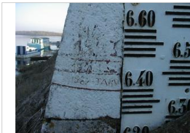
Vue du repère 1

Altitude calculée de l'eau (en m) : 32.98 m