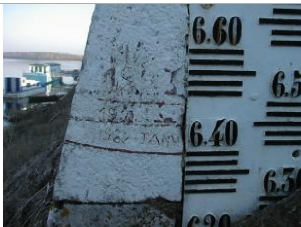
Vue du repère 1

Altitude calculée de l'eau (en m) : 32.98 m