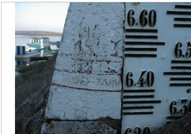
Vue du repère 1

Altitude calculée de l'eau (en m) : 33.34 m