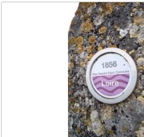
2025_Vue du repère 1856 (normalisé)

Altitude calculée de l'eau (en m) : 33.86 m