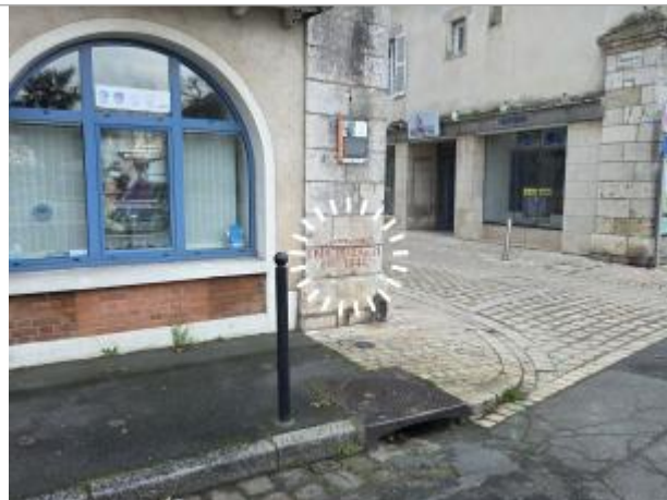
Photo du site et des deux repères historiques, décembre 2025.