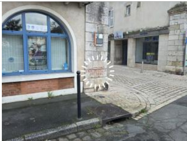
Photo du site et des deux repères historiques, décembre 2025.