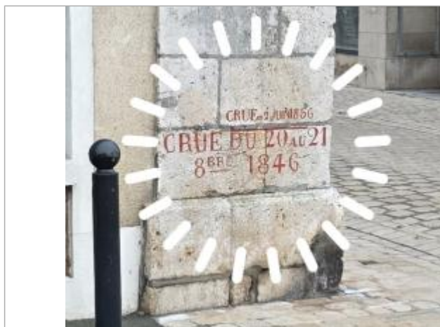
Vue rapprochée des deux repères historiques de 1846 et 1856, photo prise le 15 décembre 2025.