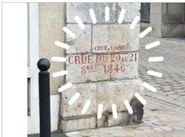
Vue rapprochée des deux repères historiques de 1846 et 1856, photo prise le 15 décembre 2025.