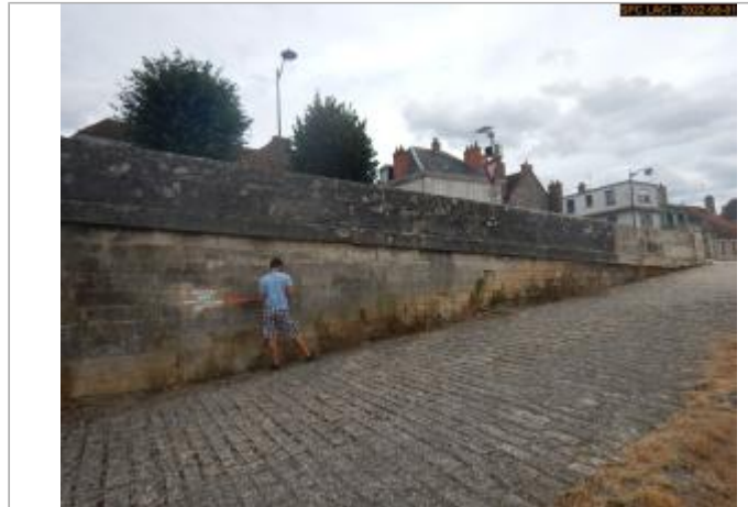
Vue du site éloignée