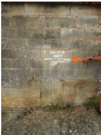
Vue du repère éloignée

Altitude calculée de l'eau (en m) : 160.13 m