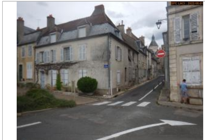
Vue du site éloignée

Coordonnées WGS84 : X: 3.01565833 / Y: 47.17666880