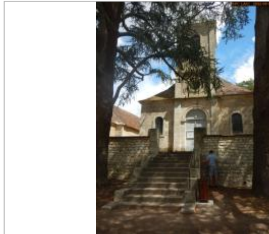
Vue du site éloignée