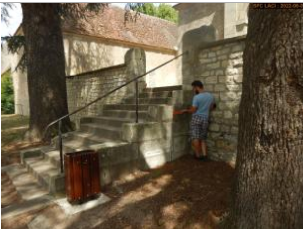
Vue du repère éloignée

Altitude calculée de l'eau (en m) : 162.72 m