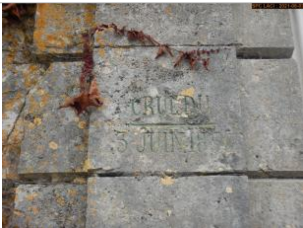
Vue du repère rapprochée en 2021 de la crue de 1856

Altitude calculée de l'eau (en m) : 77.95 m