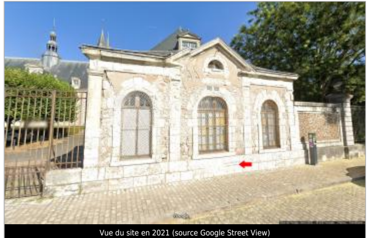
Vue du site en 2021