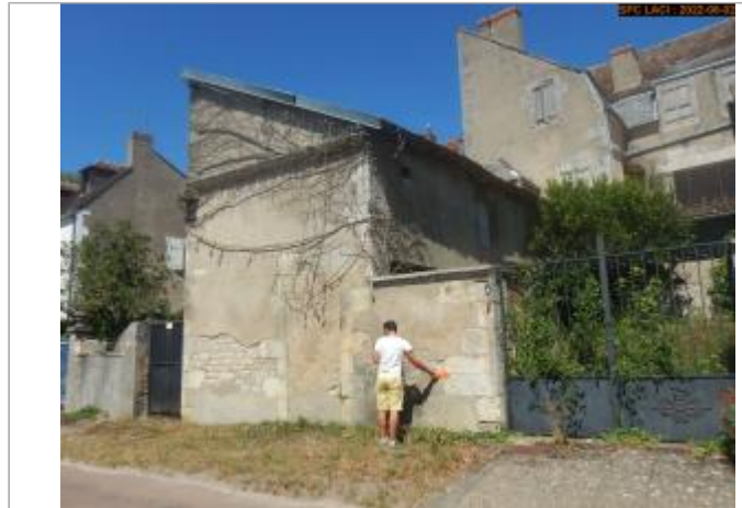
Vue du site éloignée

Coordonnées WGS84 : X: 2.95163682 / Y: 47.28412990