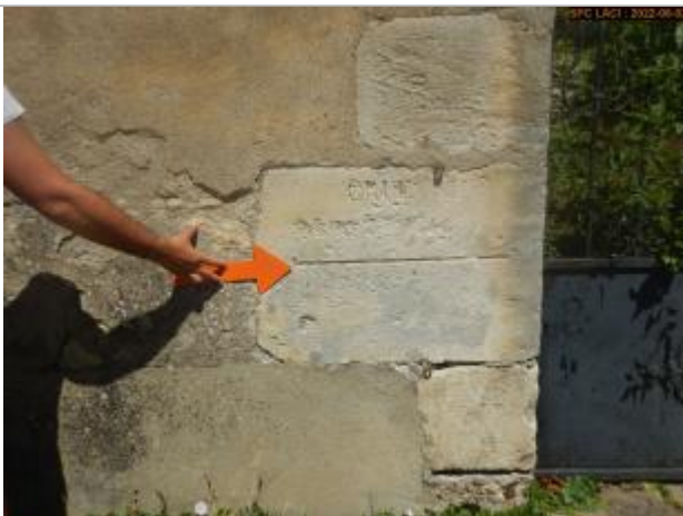
Vue du repère éloignée

Altitude calculée de l'eau (en m) : 153.95 m