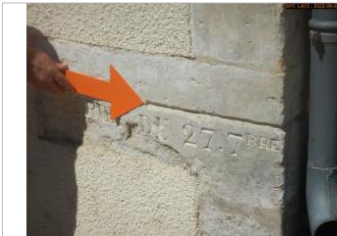
Vue du repère (angle de maison)

Altitude calculée de l'eau (en m) : 152.817 m