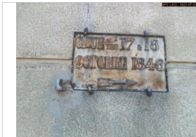
Plaque du repère située sur un mur, derrière un volet