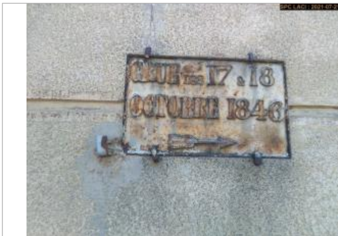
Plaque du repère située sur un mur, derrière un volet