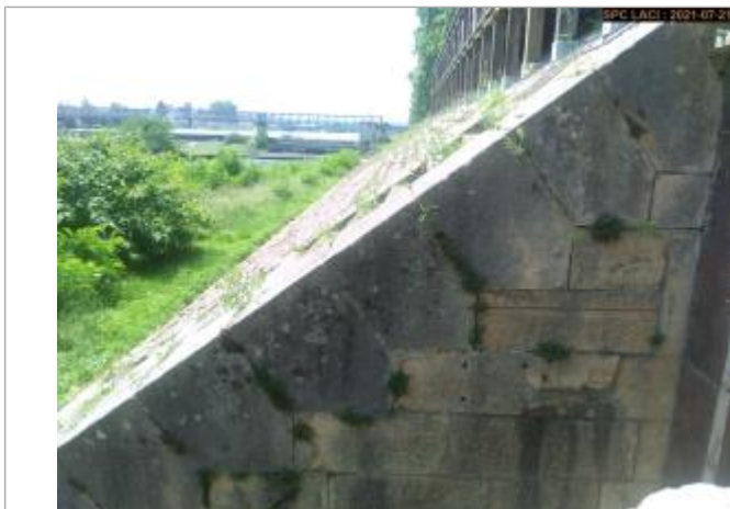
Marque gravée à proximité d'une ancienne échelle de crue rouillée