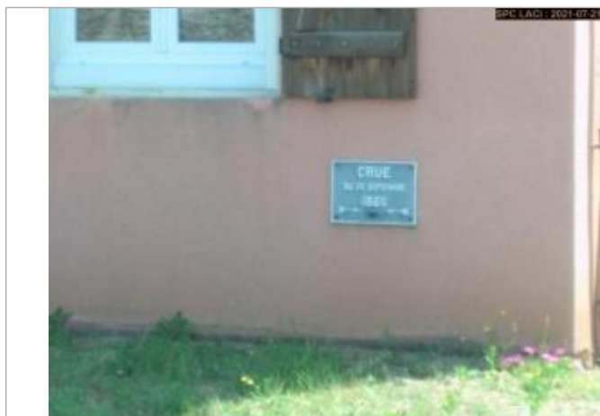
Plaque située en dessous de la fenêtre à l'entrée du bâtiment