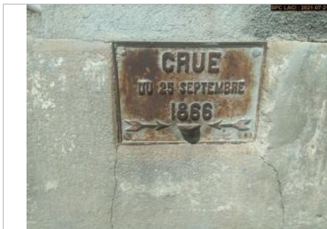
Plaque métallique en dessous du compteur électrique