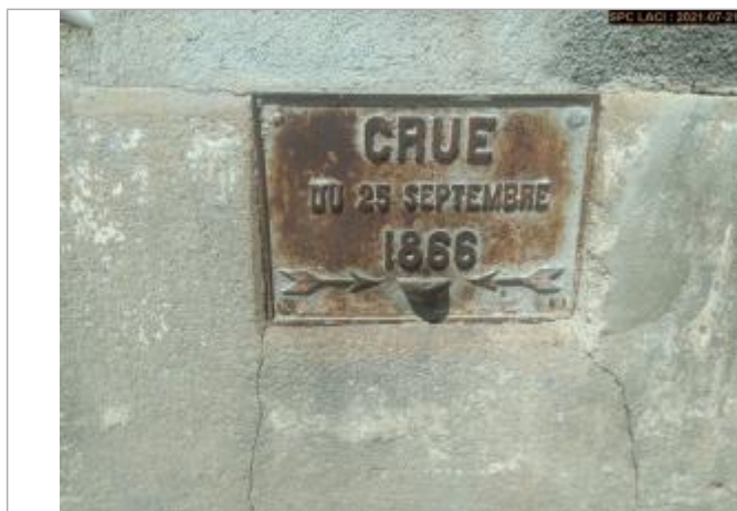
Plaque métallique en dessous du compteur électrique