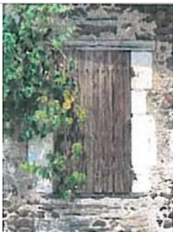
Auteur - CORELA