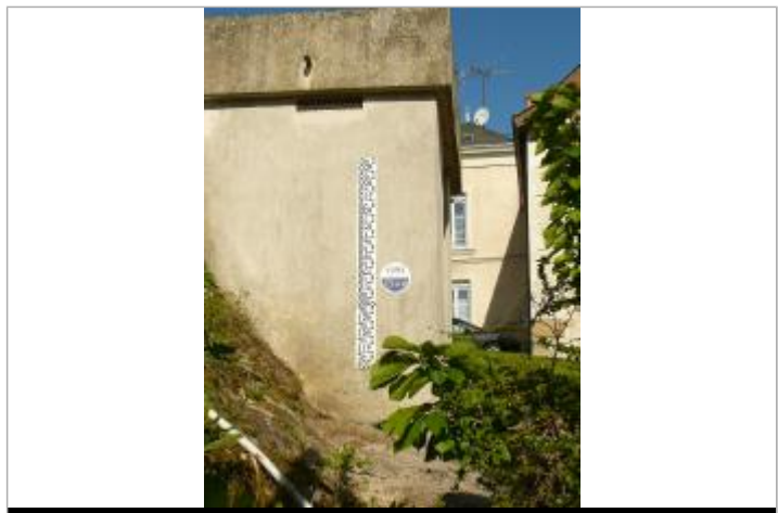
Halte nautique du Lion d'Angers - janvier 1995

GÉNÉRAL Code : WEB_R_201611033928 Date de mise à jour : 29/06/2020