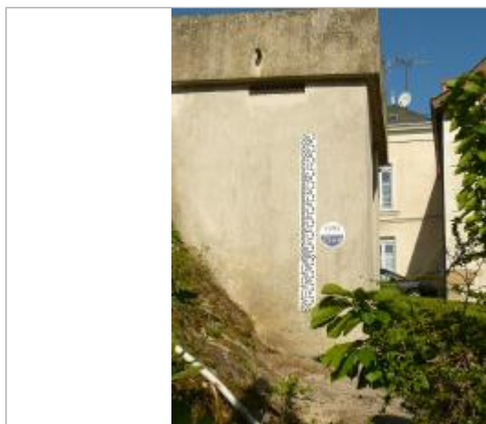
Halte nautique du Lion d'Angers - janvier 1995