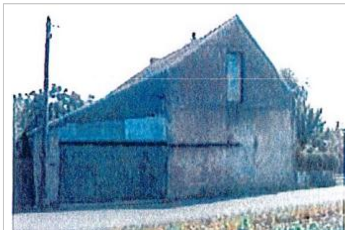
Auteur - CORELA