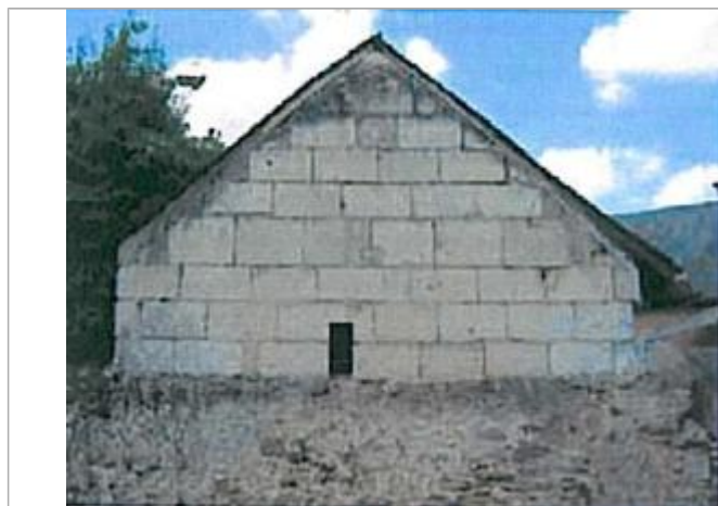
Auteur - CORELA