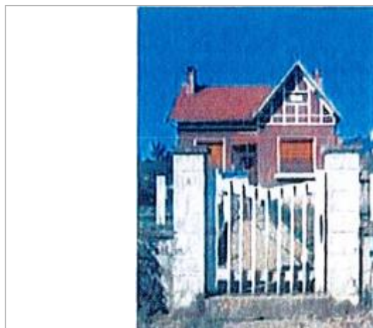
Auteur - CORELA