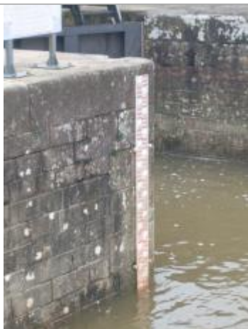
laisses de crue en aval de l'écluse - échelle à proximité

Altitude calculée de l'eau (en m) : 24.06