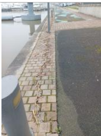
laisse de crue en rive gauche du port de Sablé