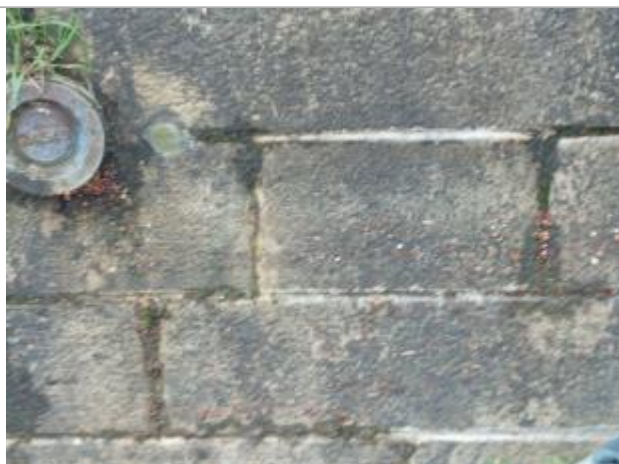
laisses de crue en amont de l'écluse de Sablé - repère de nivellement IGN à proximité