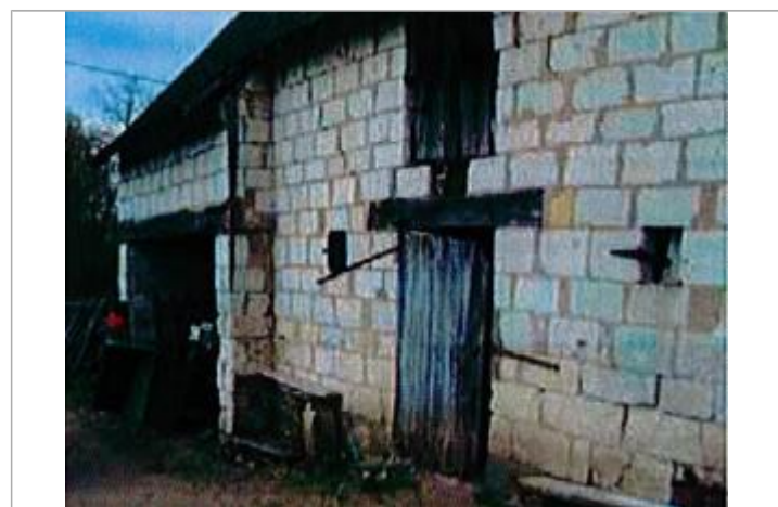
Auteur - CORELA