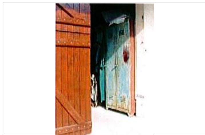
Auteur - CORELA