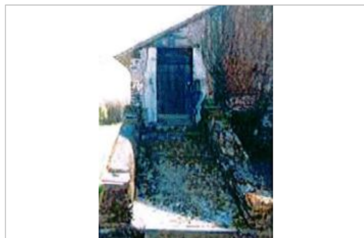
Auteur - CORELA