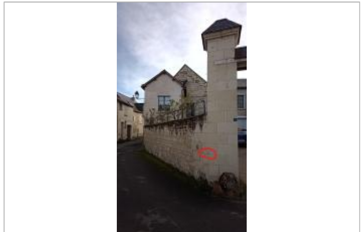
2025_Vue du site

Coordonnées WGS84 : X: 0.06661600 / Y: 47.21418440