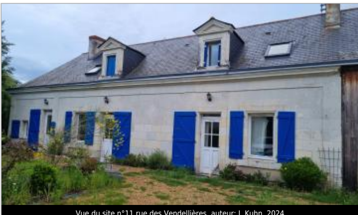
Vue du site n°11 rue des Vendellières, 2024

GÉOLOCALISATION Coordonnées WGS84 : X: -0.27410520 / Y: 47.40754350 Coordonnées RGF93 (Lambert 93) X: 453160 / Y: 6705917.99 Coordonnées RGF93 (ETRS89) : X: -0.2741052 / Y: 47.4075435 Code Hydro: ----0000 Rive de référence: Droite