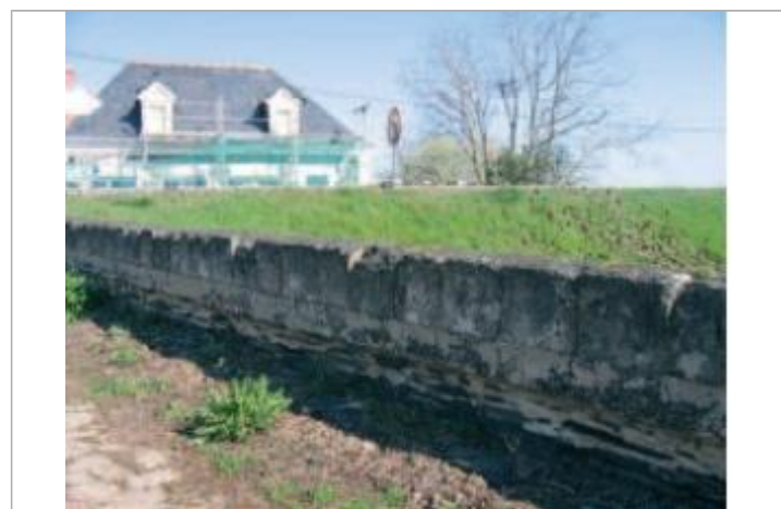
Auteur - CORELA