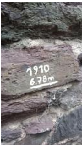
2025_Vue du repère

Altitude calculée de l'eau (en m) : 17.66