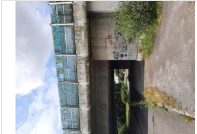
Vue sur le site

Coordonnées WGS84 : X: -1.47477040 / Y: 47.23352870