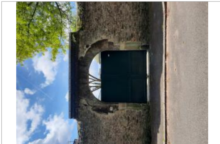
Vue sur le portail