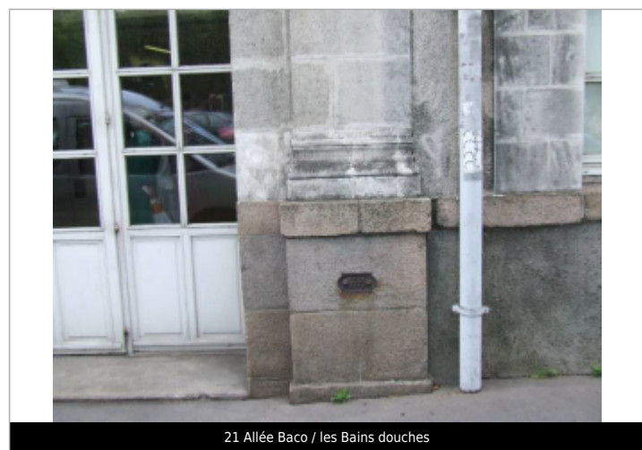
21 Allée Baco / les Bains douches