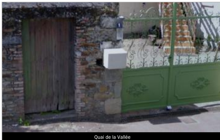
Quai de la Vallée