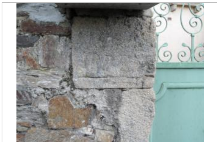
Quai de la Vallée