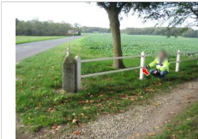
Photo du recensement d'origine (2014)